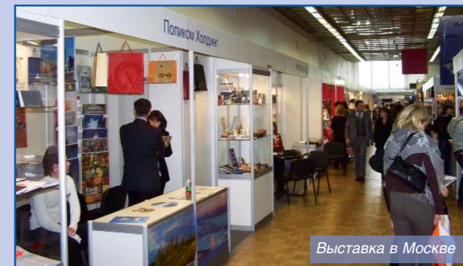
Выставка в Москве

Выставочную эстафету от Москвы принял Санкт-Петербург, где с 23 по 25 сентября в Михайловском манеже прошла 4-я выставка РАППС. Неожиданностью этой выставки стал рост количества посетителей (на 15% по сравнению с прошлым годом). Экспоненты отметили и рост